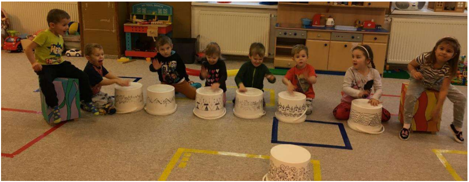
„BUBENÍCI V AKCI“