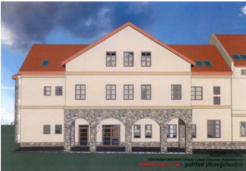
červen 2016 PROJEKTIS a z. o. s. DKřL PŘÍSTAVBA OBECNÍHO ÚŘADU v areálu Solcovny, Hejtmánstovice návrh var. č. 2 - pohled jihovýchodní