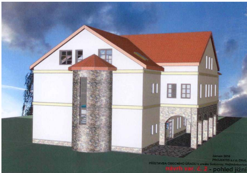
červen 2016 PROJEKTIS a z. o. s. DKřL PŘÍSTAVBA OBECNÍHO ÚŘADU v areálu Solcovny, Hejtmánstovice návrh var. č. 2 - pohled jižní